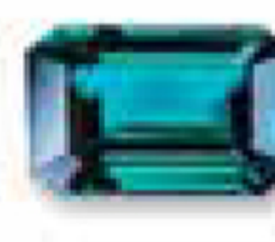
Декабрь голубой топаз