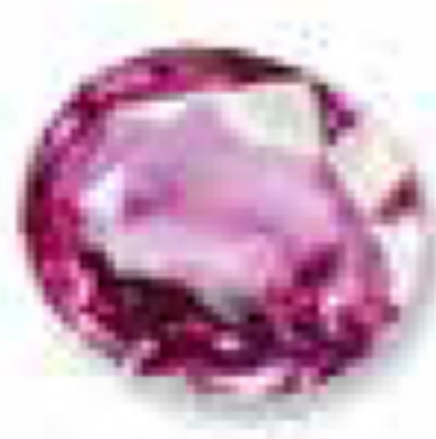
Октябрь розовый турмалин